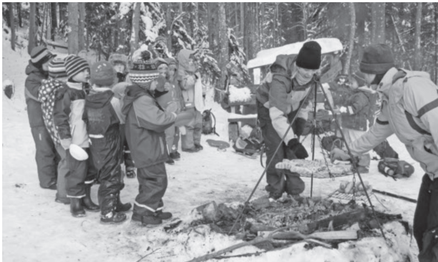
Nach einem spannenden Vormittag im Winterwald freuen sich alle auf die heissen Wienerli im Teig.