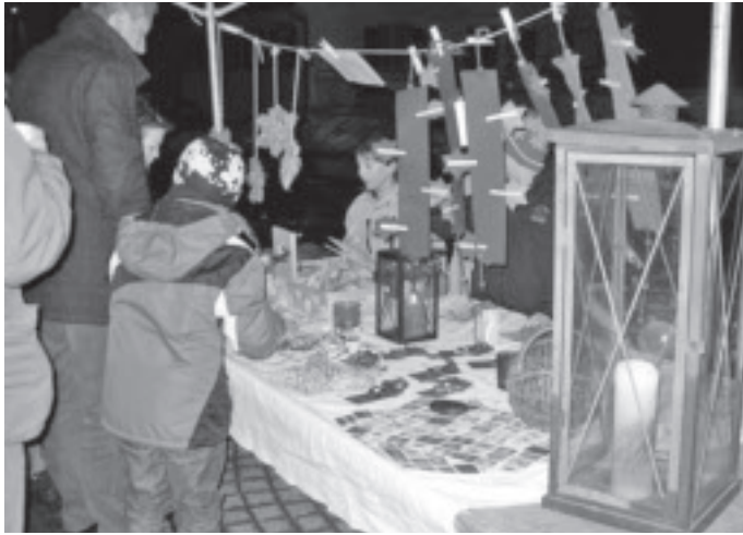
Hübsche selbst gebastelte Gegenstände warten am Weihnachtsmarkt auf Käuferinnen und Käufer.