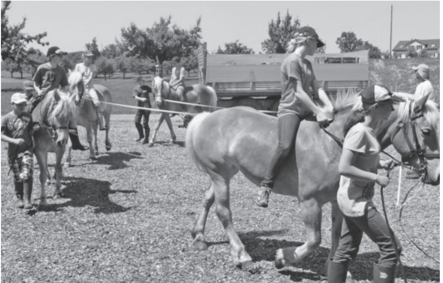
Der Umgang mit den Pferden auf dem Bauernhof Tannacker macht der Klasse Spass.