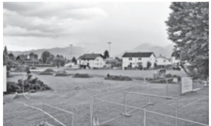
Unter der Leitung der Firma Gruner + Wepf Ingenieure AG begannen im Juni 2012 die Bauarbeiten.

Gegen diesen Entscheid wurde anschliessend von den Unterlegenen beim Verwaltungsgericht des Kantons St. Gallen Beschwerde eingereicht. Nach dem längeren Rechtsmittelverfahren wurde die Baubewilligung des Gemeinderats vom 21. September 2010 schliesslich Ende Mai 2012 rechtskräftig.