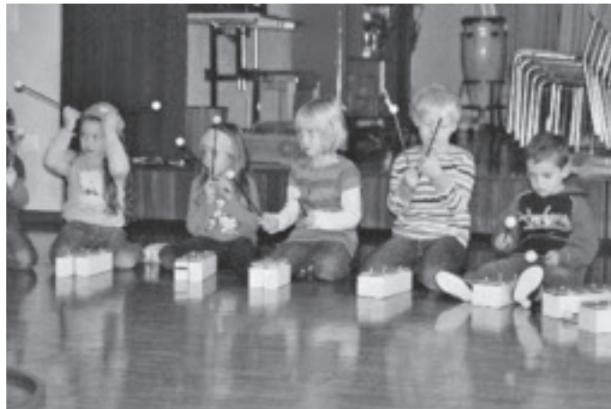
Konzentriert warten die Kindergärtler auf ihren Einsatz.

Im Konto 120.3090 wurde für Weiterbildung weniger als der budgetierte Betrag benötigt, zumal auch keine Kosten für Dolmetscherdienste anfielen. Das Budget wurde schliesslich um Fr. 1'946.– unterschritten.