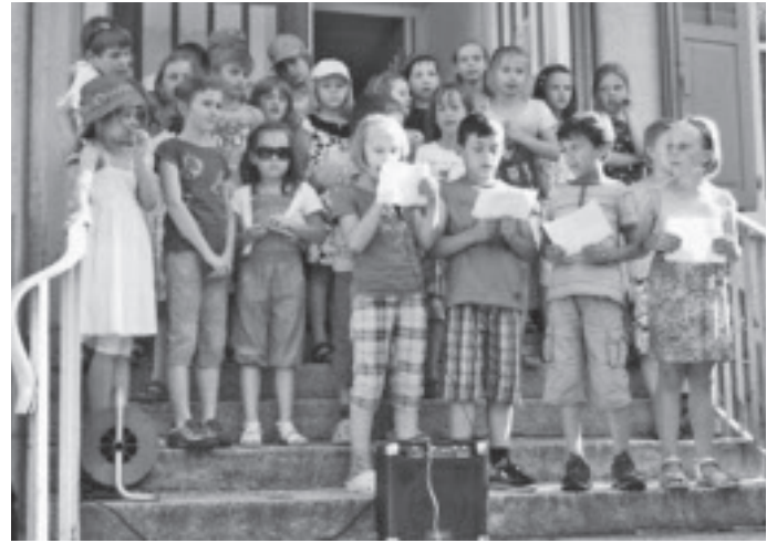
Impression vom Finissage-Anlass der MaiBlüten 2012.